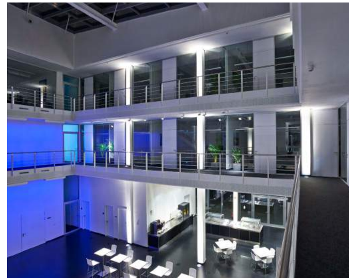
DIAL Headquarter in Lüdenscheid

Mit DIALux evo entwickeln wir den weltweiten Standard für Lichtplanungssoftware – doch das ist nicht alles. 1989 wurde DIAL als Deutsches Institut für Angewandte Lichttechnik gegründet. Seither bieten wir ein breites Spektrum an Kompetenzen im Bereich Software, Lichtplanung und -technik und Gebäudeautomation.